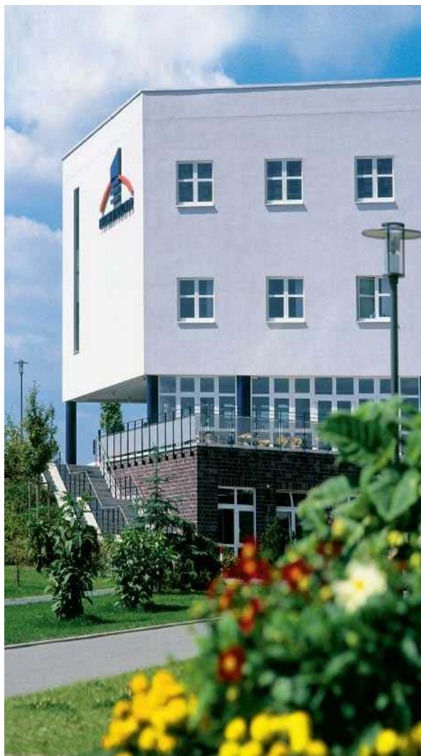
Abbildung: Blick auf den Eingangsbereich und die Cafeteria der Pleißental-Klinik GmbH

Die Betriebsleitung der Pleißental-Klinik GmbH